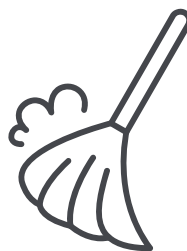
ブース周りの清掃