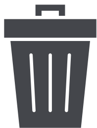
ゴミ・廃棄物のお持ち帰り

上記禁止事項に限らず、主催者の指示に従っていただけない場合は、営業停止・次回以降の出店を禁止とさせていただきます。