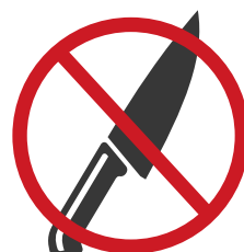
刃物など危険物販売

上記禁止事項に限らず、主催者の指示に従っていただけない場合は、営業停止・次回以降の出店を禁止とさせていただきます。