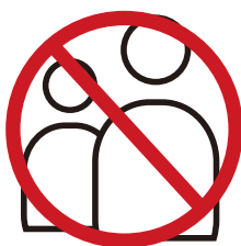
店舗外での呼び込み