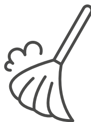
ブース周りの清掃