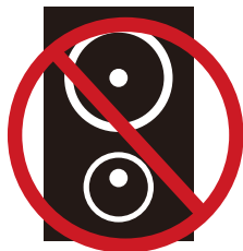
騒音・大声での客引き